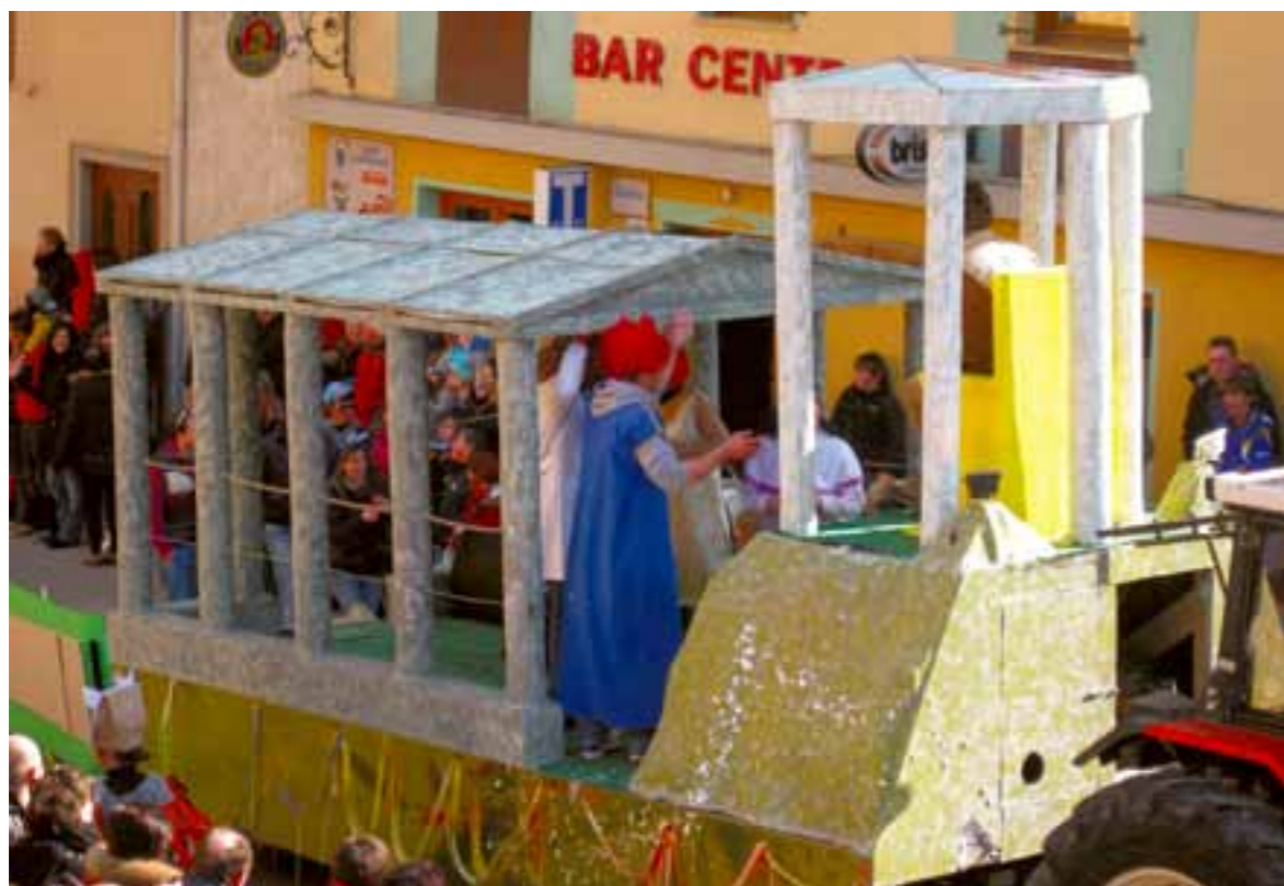
Carnevale a Rabbi 2011