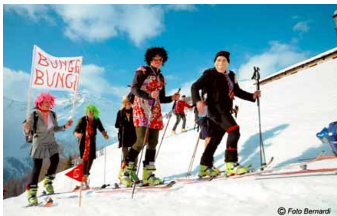
Ski Alp Rabbi febbraio 2011 (gruppo mascherato).