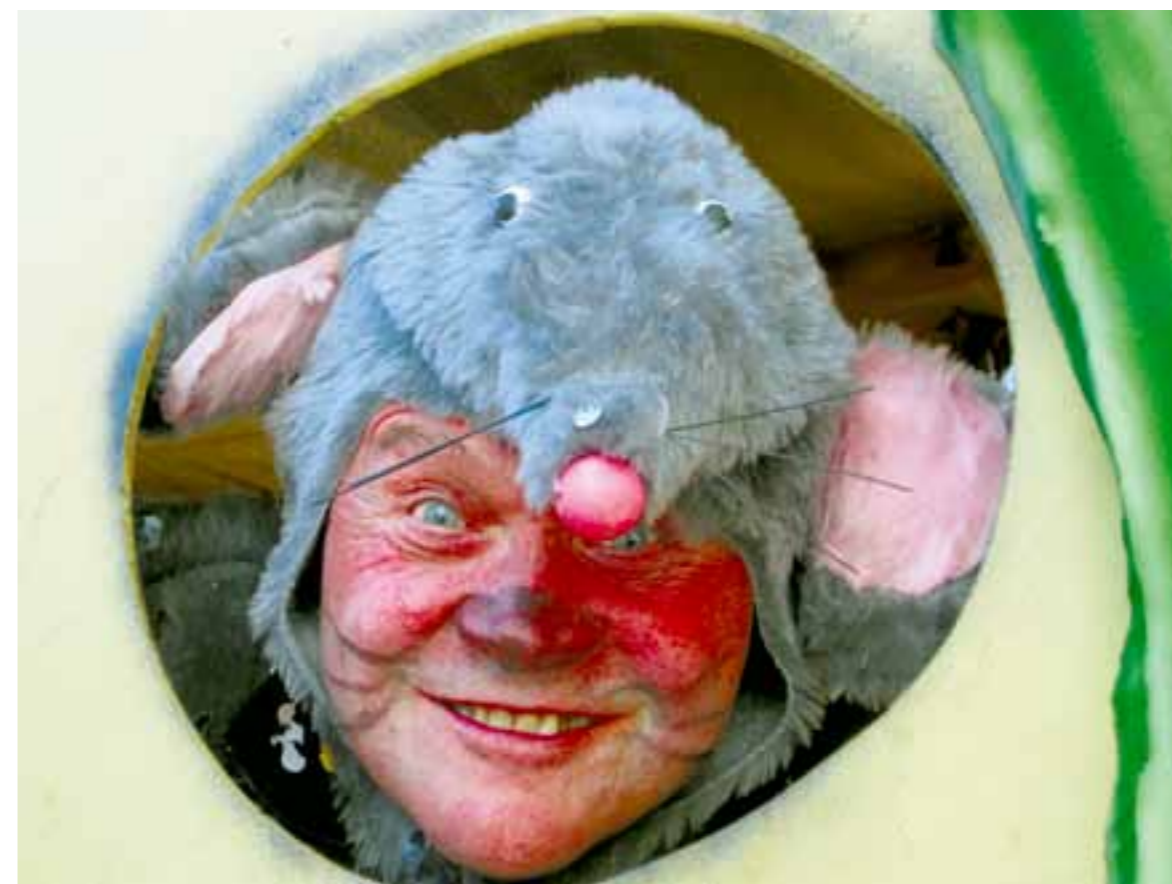
Carnevale a Rabbi 2011.