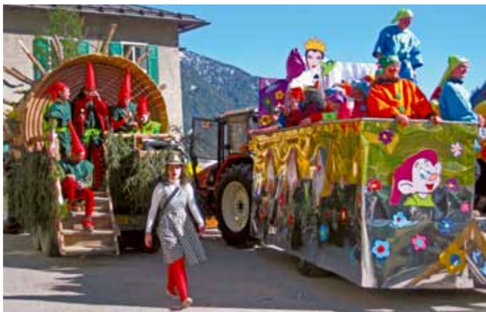
Carnevale a Rabbi 2011.