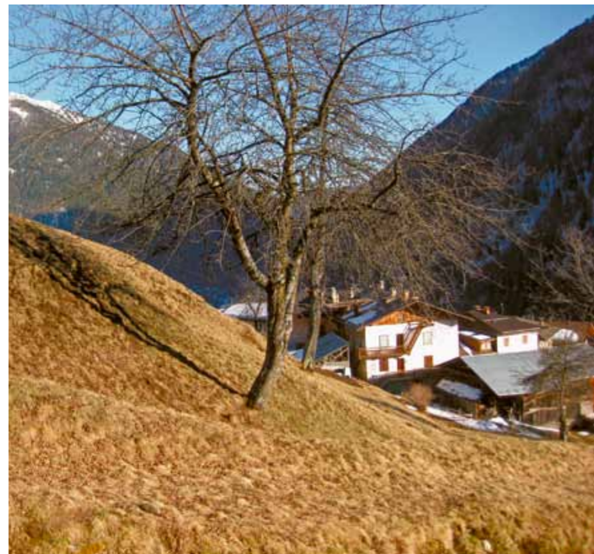
Primavera a Le Caneve.

Bene, eccolo! Ho letto con particolare interesse l'articolo pubblicato sul notiziario Rabbinforma n. 4 di dicembre 2010 intitolato "Volevo dirti che...". Ne ho condiviso il tono ma soprattutto il contenuto. Quante verità sono state dipinte in un testo così breve! Mi è piaciuto leggerlo e rileggerlo perché nelle sue poche righe, vengono ben descritti, con chiarezza ma