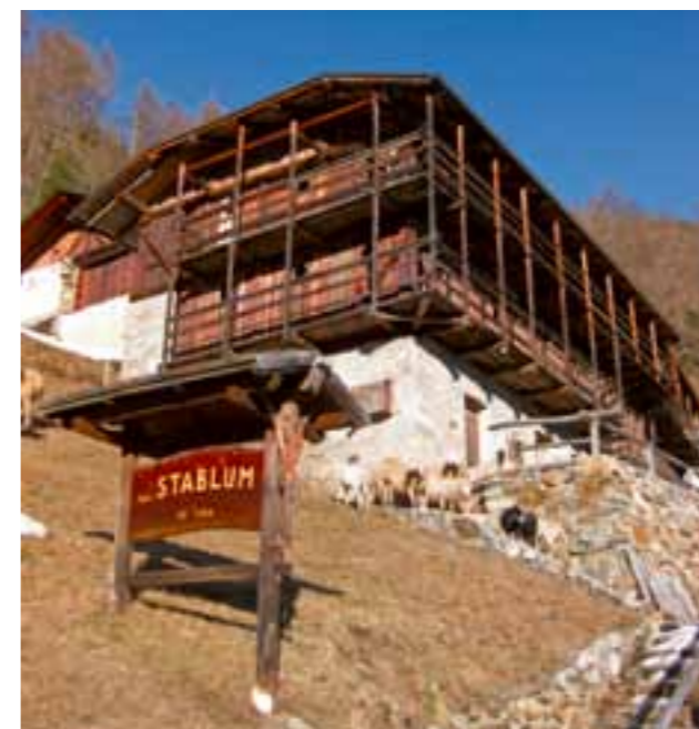
Località Stablum, primavera 2011.

Per il Comitato parrocchiale Michele Iachellini