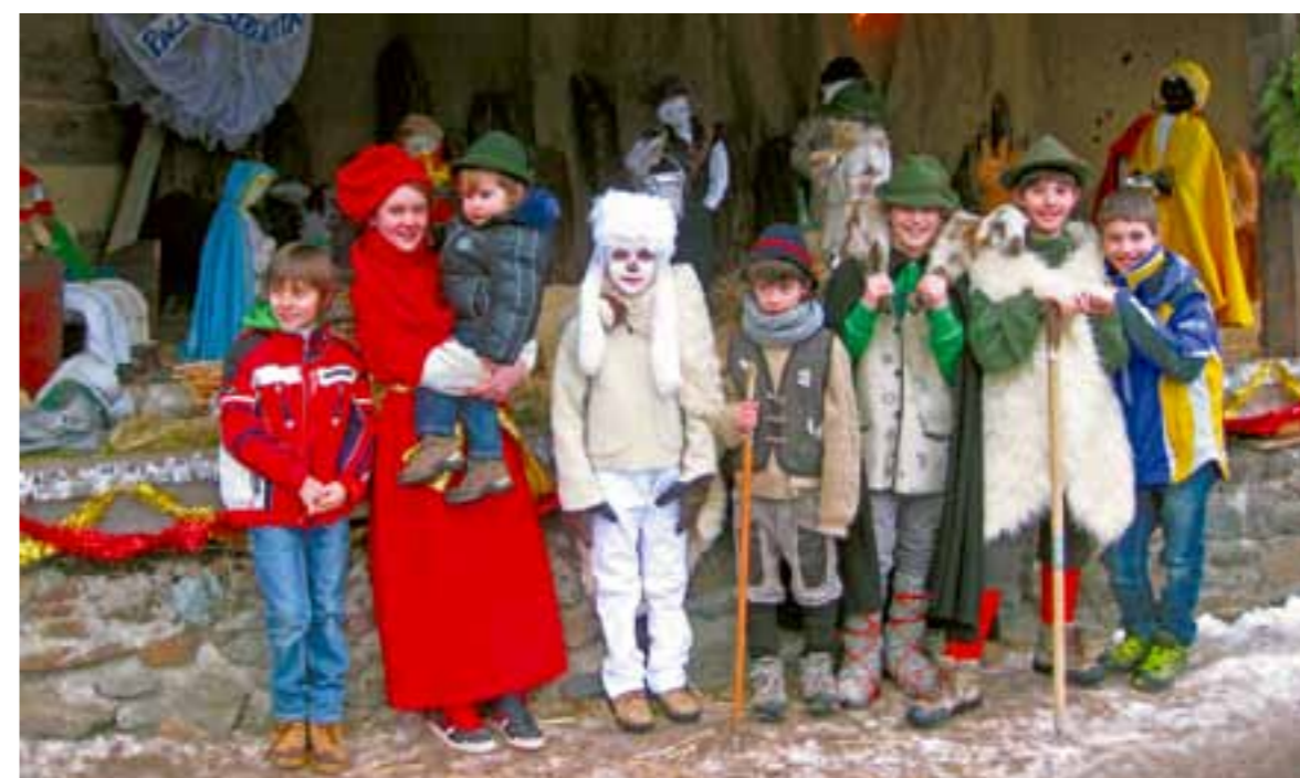
"In cammino tra i presepi della Val di Rabbi 2010-2011": Presepe vivente a Piazzola il giorno dell'Epifania.

L'Amministrazione comunale coglie l'occasione offerta dalla pubblicazione di questo articolo per ringraziare tutti coloro che a vario titolo hanno contribuito a organizzare e realizzare l'iniziativa "Il cammino dei presepi della Val di Rabbi 2010/2011". Dagli alberi di Natale di Pracorno ai presepi artigianali di San Bernardo e di Piazzola, la valle tutta illuminata si è stretta in un unico caldo abbraccio.