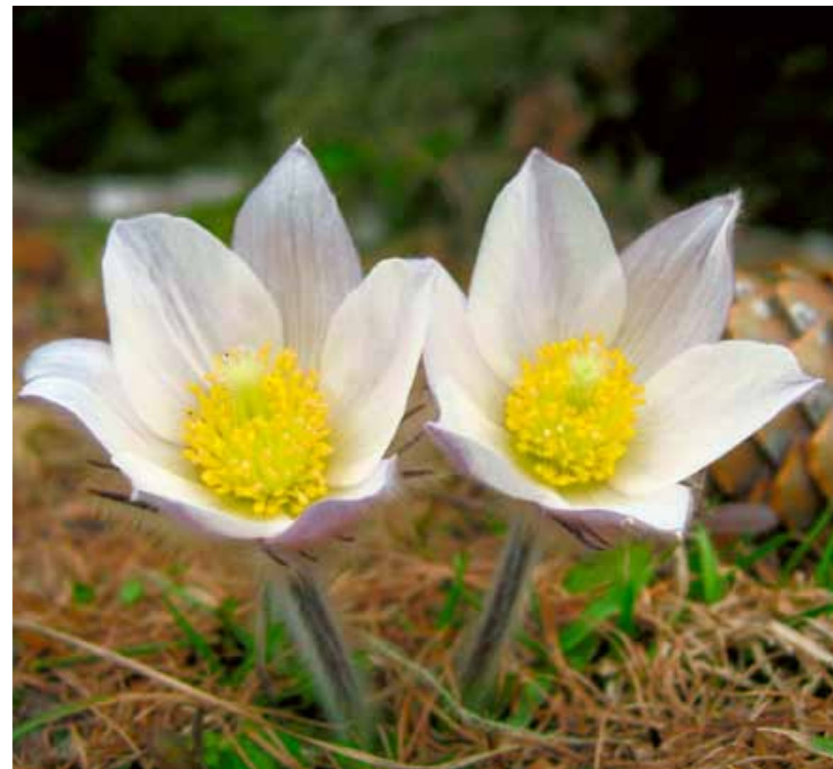
Pulsatilla vernalis.

soprattutto con coraggio, stati d'animo e situazioni che purtroppo io spesso vivo, soprattutto quando vengo a Rabbi. Mi riferisco a tutte quelle persone che hanno deciso di non parlare con onestà, che hanno deciso, non si sa bene il perché, di innalzare quel muro che ci separa l'uno dall'altro, anche se l'altro è magari un fratello ... A tutti coloro che, in nome di un livore ingiustificato, hanno deciso di non sforzarsi, né di comprendere né di perdonare, ma invece di criticare e giudicare.