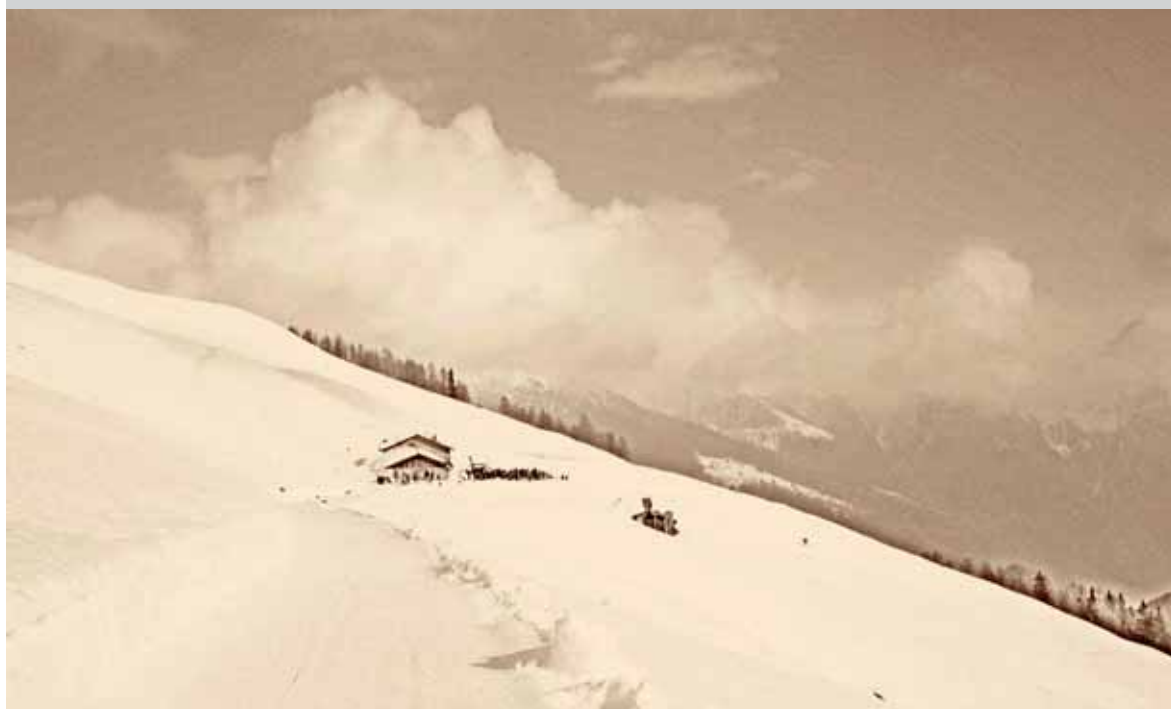
Raduno Ski Alp Rabbi