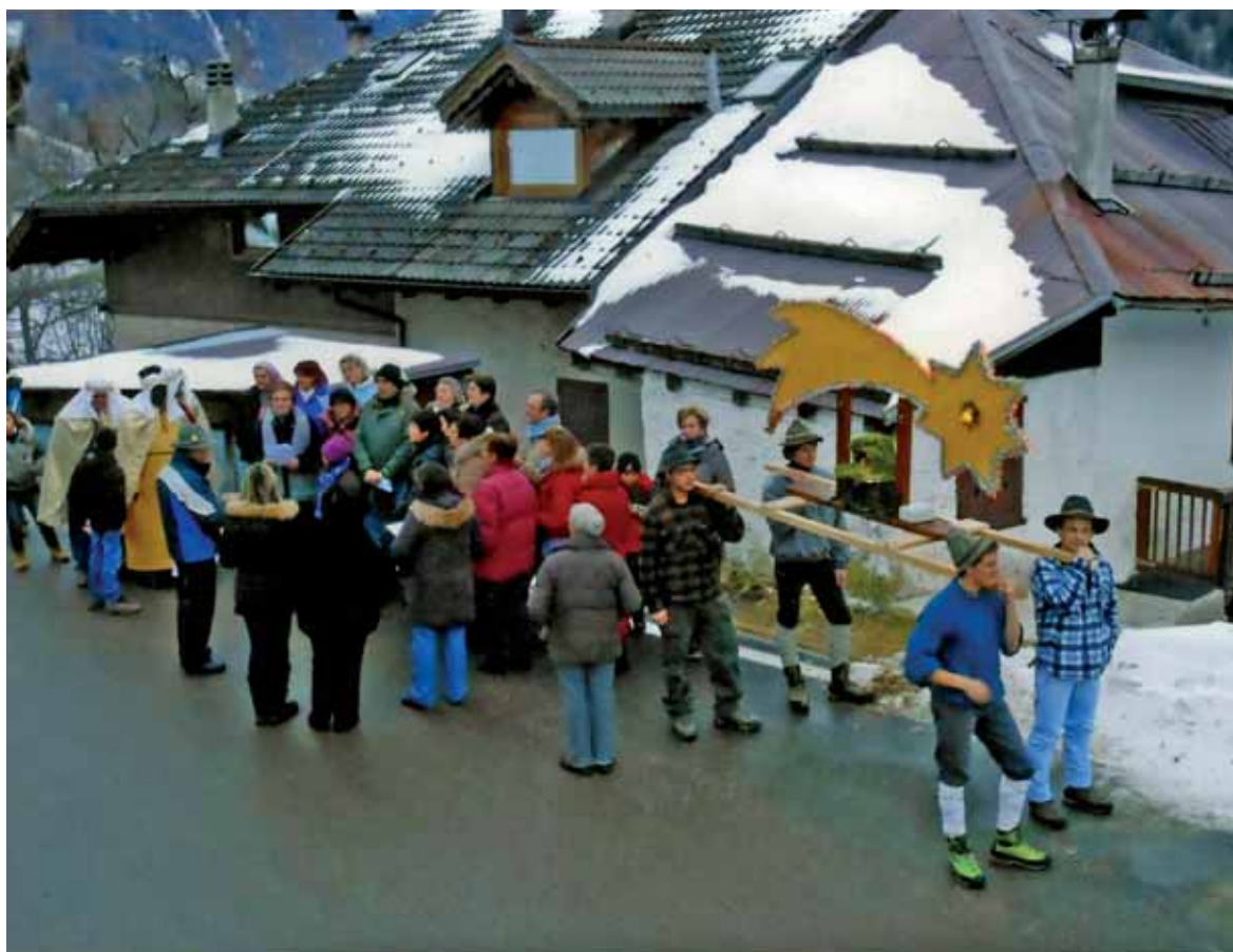
La tradizione della "Stelâ del Nadal", Festività natalizie 2011-2012.