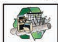
METALLI e FERRO