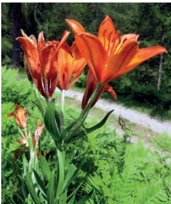
Rododendro bianco in Val Cercen – Rabbi, estate 2013